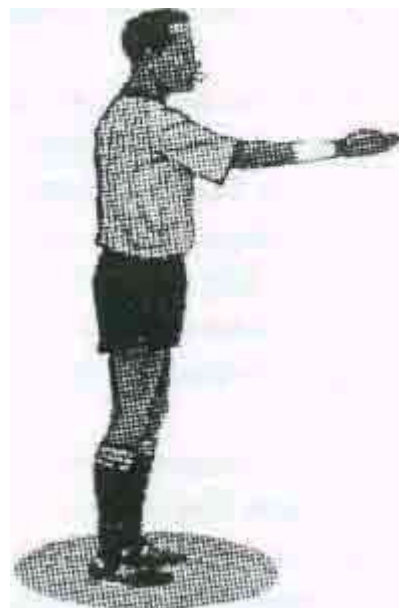
НАЧАЛО И ВОЗБНОВЛЕНИЕ ИГРЫ