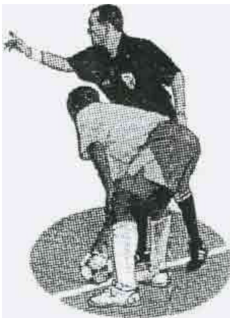
УДАР МЯЧА С БОКОВОЙ